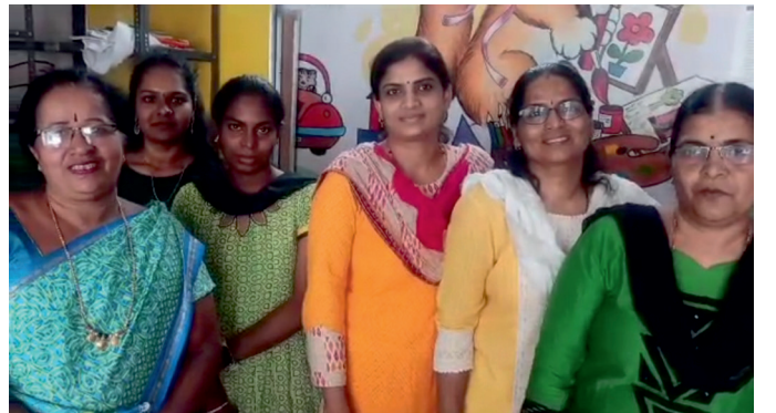
ನಳಂದ ಸಂಸ್ಥೆಯ ಸಿಬ್ಬಂದಿ ವರ್ಗ