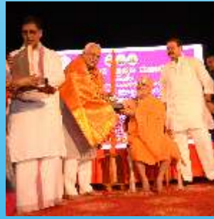
ಆರ್.ವಿ. ದೇಶಪಾಂಡೆ ಮಾನ್ಯ ಶಾಸಕರು, ಹಳಿಯಾಕ ಕ್ಷೇತ್ರ