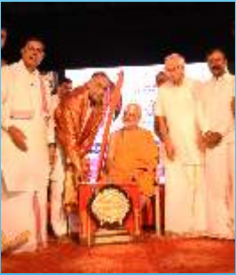
ಶ್ರೀ ದಿನೇಶ್ ಗುಂಡೂರಾವ್ ಮಾನ್ಯ ಉನ್ನತ ಶಿಕ್ಷಣ ಸಚಿವರು