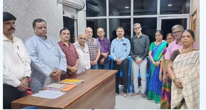
ಬಸವನಗುಡಿ ಕ್ಷೇತ್ರ ಭ್ರಾಹ್ಮಣ ಸಂಘ