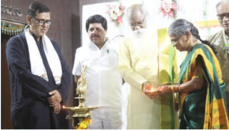
ಮಲ್ಲೇಶ್ವರಂ ಭ್ರಾಹ್ಮಣ ಸಭಾ ಪ್ರಸ್ಥೆ