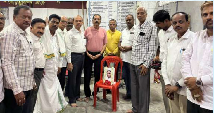
ಜಿಲ್ಲಾ ಭ್ರಾಹ್ಮಣ ಸಂಘ ರಾಯಚೂರು