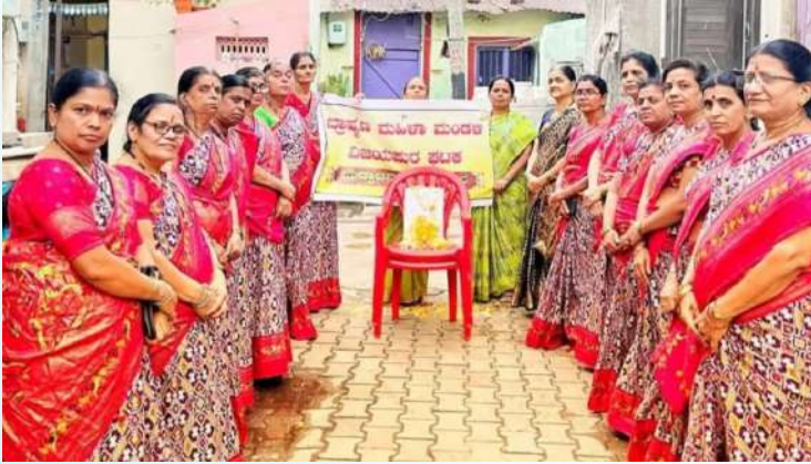
ವಿಜಾಪುರ ಭ್ರಾಹ್ಮಣ ಮಹಿಳಾ ಮಂಡಳಿ