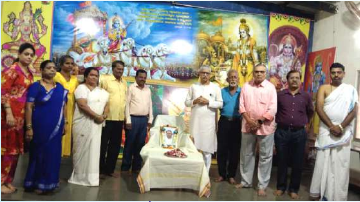
ಧಾರವಾಡ ಜಿಲ್ಲಾ ಭ್ರಾಹ್ಮಣ ಸೇವಾ ಸಂಘ ಹಾಗೂ ಗಾಯತ್ರಿ ಪ್ರತಿಷ್ಠಾನ