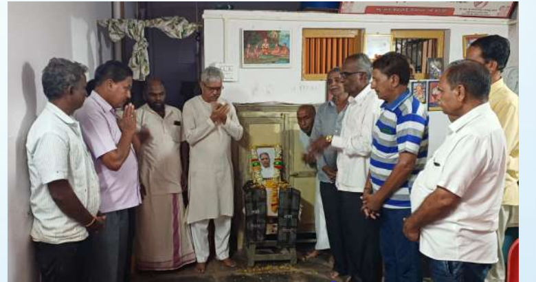
ಭ್ರಾಹ್ಮಣ ಸಮಾಜ ಕುಂದಗೋಳ ತಾ.