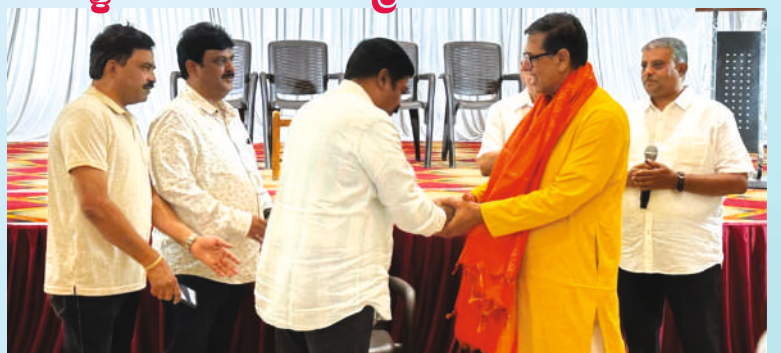
ಬೆಳಗಾವಿ ಜಲ್ಲಾ ಭ್ರಾಹ್ಮಣ ಸಮಾಜ ಪ್ರಸ್ಥೆ