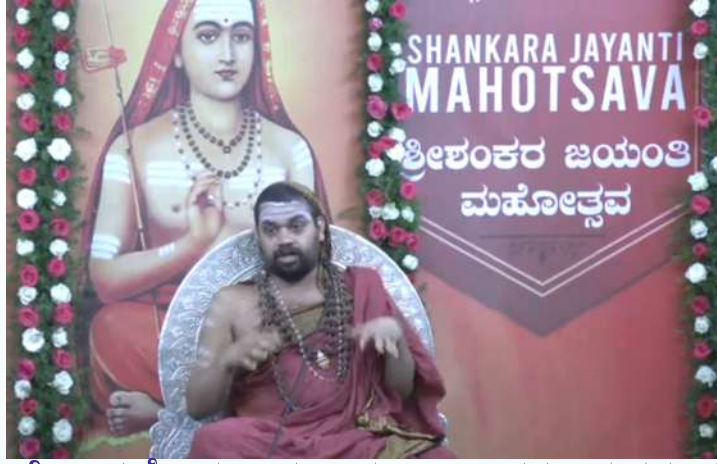
ಜಗದ್ಗುರು ಶ್ರೀ ವಿಧುಶೇಖರ ಭಾರತೀ ಮಹಾಸ್ವಾಮಿಗಳ ಅನುಗ್ರಹ ಆಶೀರ್ವಚನ