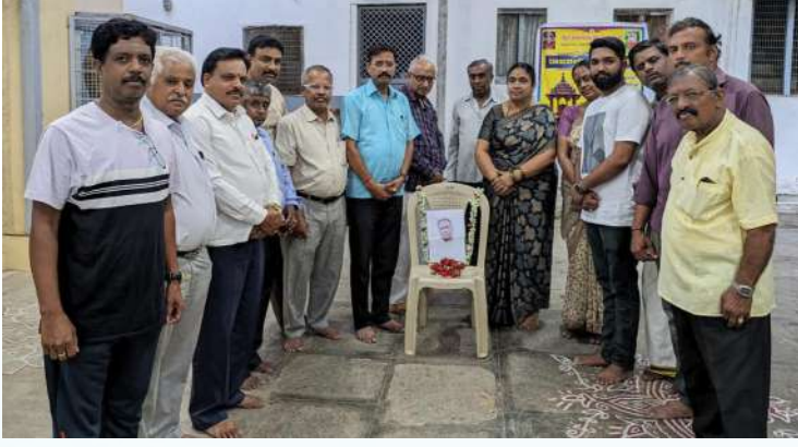
ಚಿಂತಾಮಣಿ ತಾಲ್ಲೂಕು ಭ್ರಾಹ್ಮಣ ಸಂಘ