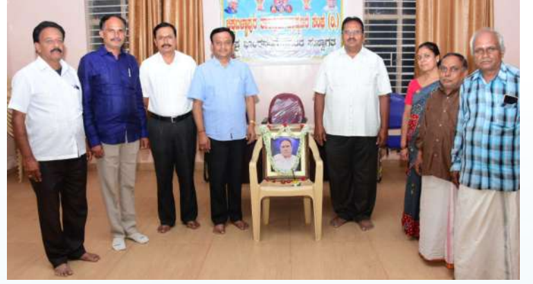
ಚಿಕ್ಕಬಳ್ಳಾಪುರ ತಾಲೂಕು ಭ್ರಾಹ್ಮಣ ಸಂಘ