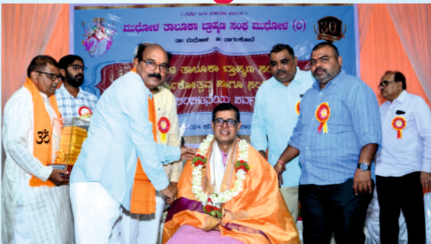
ಮುಧೋಳ ಭ್ರಾಹ್ಮಣ ಸಂಘ