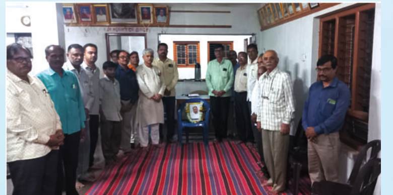
ಗದಗ ಜಿಲ್ಲಾ ಭ್ರಾಹ್ಮಣ ಸಂಘ