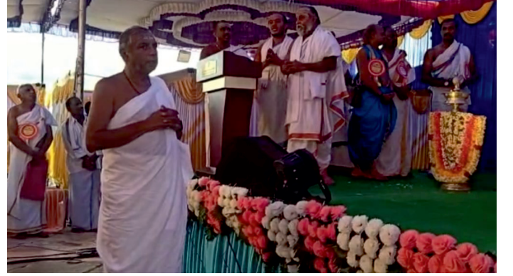
ಸಮಾಜದ ಧೃಡತೆಗಾಗಿ ಪ್ರತಿಯೊಬ್ಬರೂ ಶ್ರಮಿಸಬೇಕು. ಆಗ ಜೀವನದ ಸಾರ್ಥಕವಾಗುತ್ತದೆ ಎಂದು ನುಡಿದರು