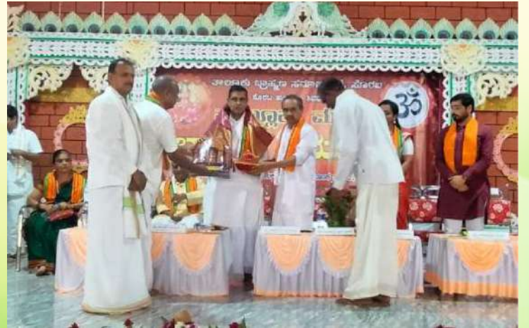
ಶಿವಮೊಗ್ಗ ಜಿಲ್ಲೆ ಸೊರಬ ತಾಲ್ಲೂಕು ಬ್ರಾಹ್ಮಣ ಸಮಾವೇಶ,