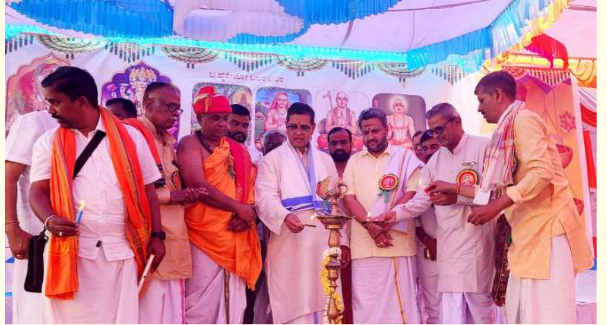
ವಿಪ್ರ ಜಾಗೃತಿ ಮಹಾ ಸಮಾವೇಷ ಕೆಂಭಾವಿ, ಯಾದಗಿರಿ ಜಿಲ್ಲೆ