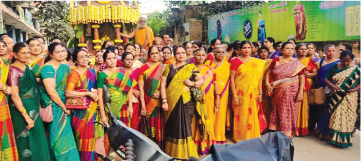
ಮಲ್ಲೇಶ್ವರಂ ಬ್ರಾಹ್ಮಣ ಸಭಾ - ತ್ಯಾಗರಾಜರ ಆರಾಧನೆ ಕಾರ್ಯಕ್ರಮ