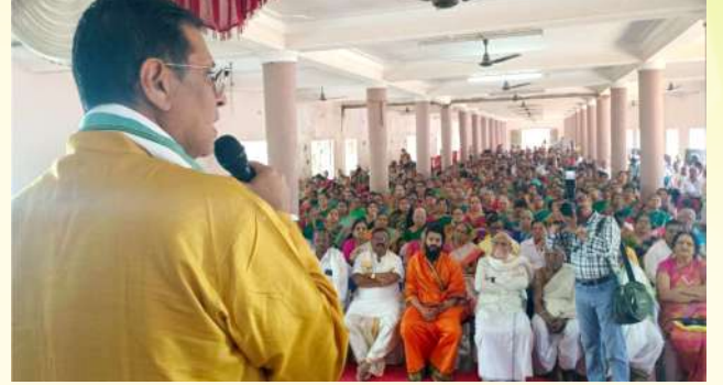
ಹಾವೇರಿ ಜಿಲ್ಲಾ ಪ್ರಥಮ ಬ್ರಾಹ್ಮಣ ಸಮಾವೇಶ