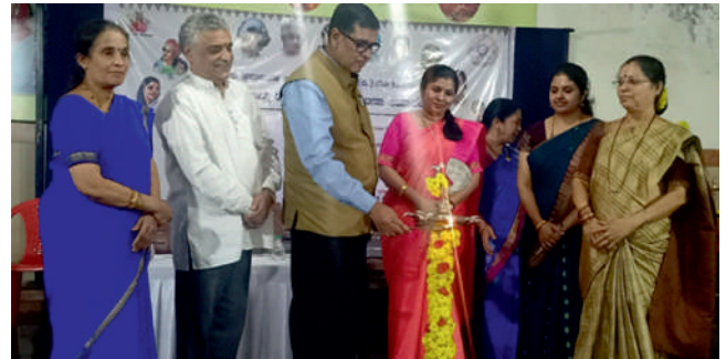
ಶಿವಮೊಗ್ಗ ಜಿಲ್ಲಾ ಮಹಿಳಾ ವಿಭಾಗದ ಉದ್ಘಾಟನೆ