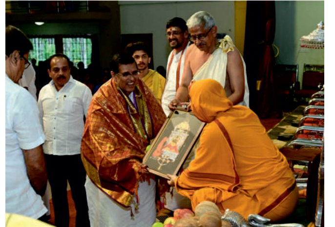
ಶ್ರೀ ರಾಘವೇಶ್ವರ ಭಾರತಿ ಸ್ವಾಮಿಗಳಿಂದ ಮಾಣಿ ಮಠದಲ್ಲಿ ಅಧ್ಯಕ್ಷರಿಗೆ ಗೌರವ ಸರ್ಮಪಣೆ