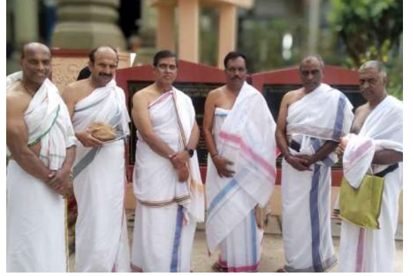
ಜಗದ್ಗುರುಗಳ ದರ್ಶನದ ನಿರೀಕ್ಷೆಯಲ್ಲಿ

ಸಮ್ಮೇಳನದ ದಿನಾಂಕವನ್ನು ಶೀಘ್ರದಲ್ಲೇ ಸಮಸ್ತ ವಿಪ್ರ ಬಂಧುಗಳಿಗೆ ತಿಳಿಸಲಾಗುವುದು.