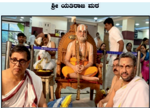
ಶ್ರೀ ಯತಿರಾಜ ಮಠ