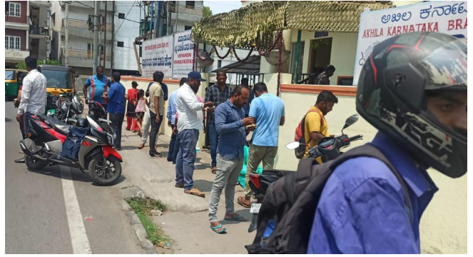
ಗಾಯತ್ರಿಭವನದಲ್ಲಿ ಶ್ರೀ ರಾಮನಾಮಿಯಂದು ವಿಶೇಷ ಪೂಜೆಯೊಂದಿಗೆ ಪಾನಕ, ಕೊಸಂಬರಿ, ಹಣ್ಣುಗಳನ್ನು ಸಾರ್ವಜನಿಕರಿಗೆ ವಿತರಿಸಲಾಯಿತು.