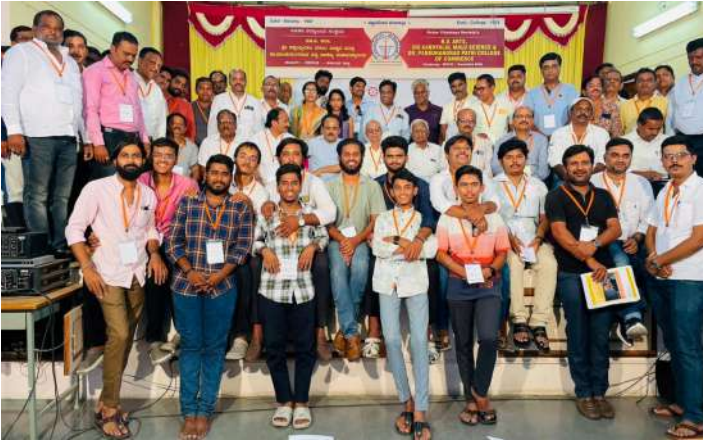
ಬ್ರಾಹ್ಮಣ ವ್ಯಾಪಾಲಿ ಮತ್ತು ವಾಣಿಜ್ಯೋದ್ಯಮಿಗಳ ವೇದಿಕೆ ಸಮಾವೇಶ, ಕಲಬುರ್ಗಿ