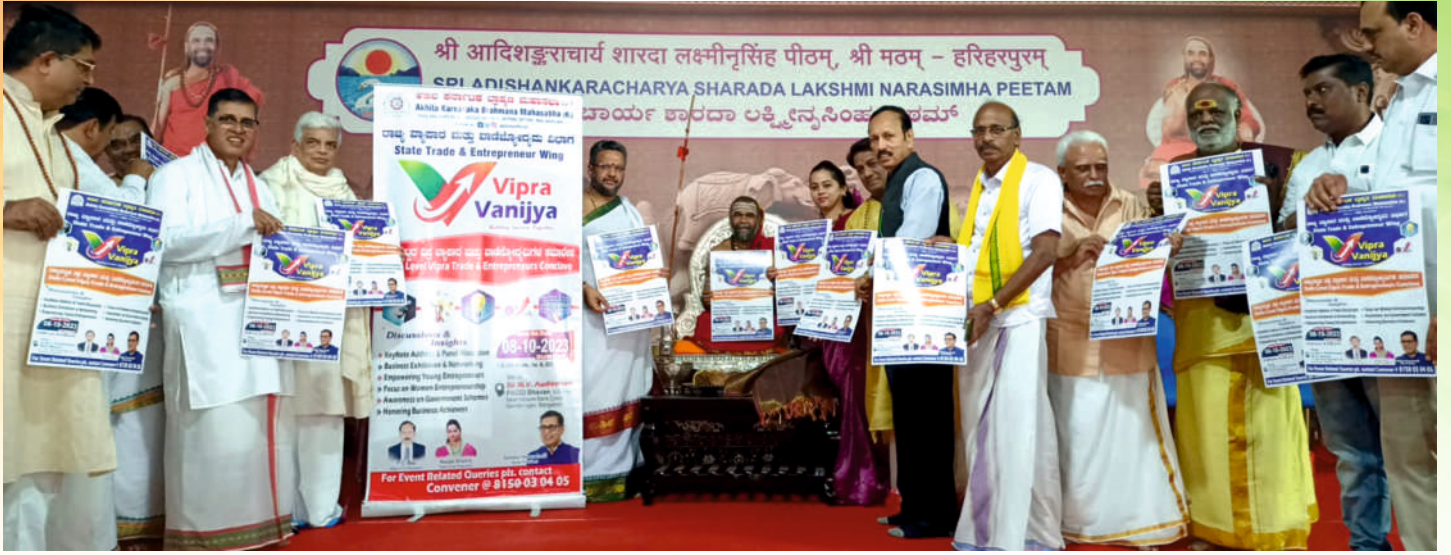
ಹಲಿಹರಪುರ ಶ್ರೀಗಣಂದ ವಾಣಿಜ್ಯೋದ್ಯಮಿಗಳ ಬೆಂಗಳೂರು ಸಮಾವೇಶದ ಅಧಿಕೃತ ಭತ್ತಿಷತ್ರ ಬಡುಗಡೆ