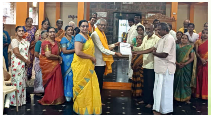
ಕುಂದಗೋಲದಲ್ಲ ಗೀತಾ ಸಪ್ತಾಹ, ಸದಸ್ಯತ್ವ ಅಭಿಯಾನ