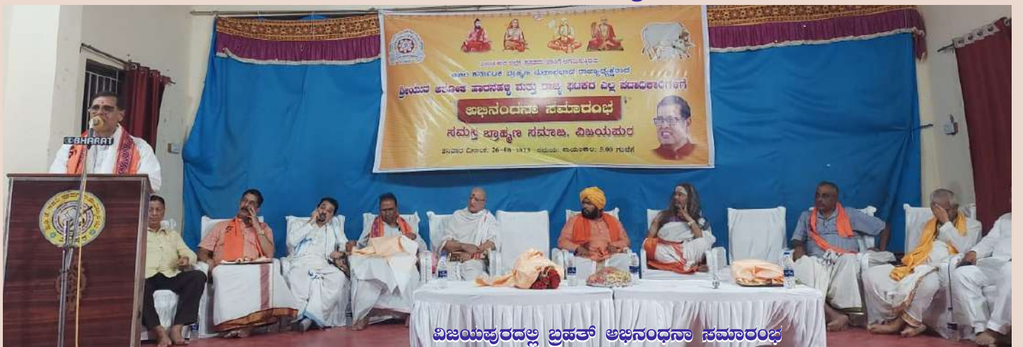
ವಿಜಯಪುರದಲ್ಲಿ ಬ್ರಹ್ಮಚರಿ ಅಭಿನಂದನಾ ಸಮಾರಂಭ