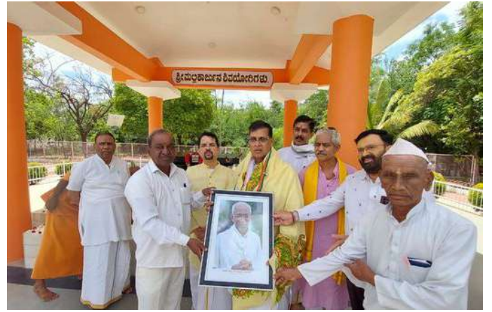
ಜ್ಞಾನಯೋಗಾಶ್ರಮದ ಸಿದ್ಧೇಶ್ವರ ಶ್ರೀ ಹವಿತ್ರ ಸ್ಥಳಕ್ಕೆ ಮಾನ್ಯ ಅಧ್ಯಕ್ಷರ ಭೇಟಿ