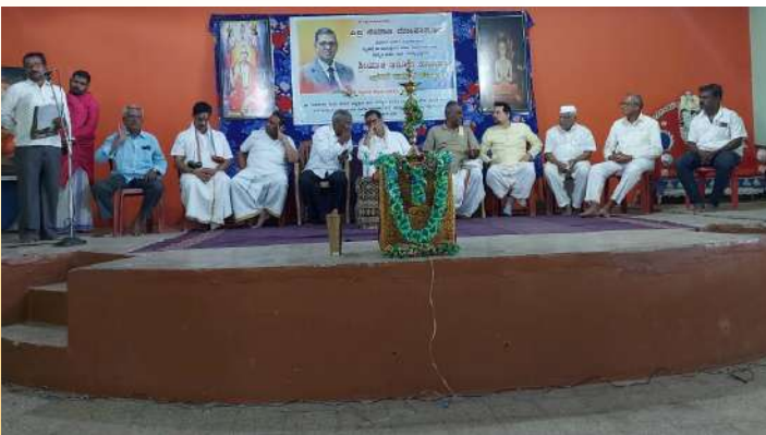
ಲೋಕಾಪುರ ವಿಷ್ರ ಸಮಾಜದೊಂದಿಗೆ ಸಮಾಲೋಚನೆ ಸಂದರ್ಭ