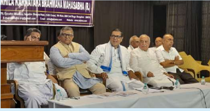
ರಾಜ್ಯದ ವಿವಿಧ ಬ್ರಾಹ್ಮಣ ಪಂಗಡಗಳ ಹಾಗೂ ಸಂಘಗಳ ಪದಾಧಿಕಾರಿಗಳ ಸಮಾವೇಶ