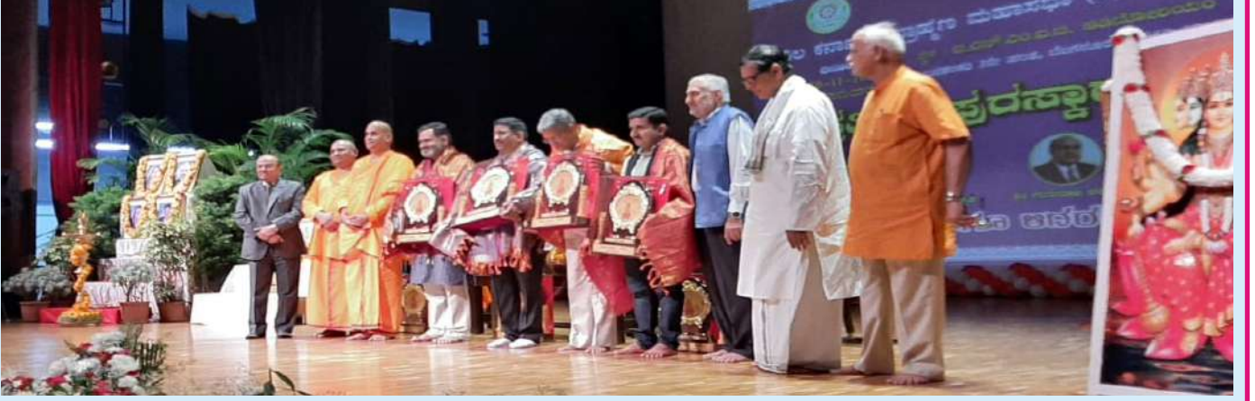
ಪ್ರತಿಭೆಗಳನ್ನು ಪ್ರೋತ್ಸಾಹಿಸಿದ ಗಣ್ಯರಿಗೆ ಗೌರವ ಸಮರ್ಪಣೆ