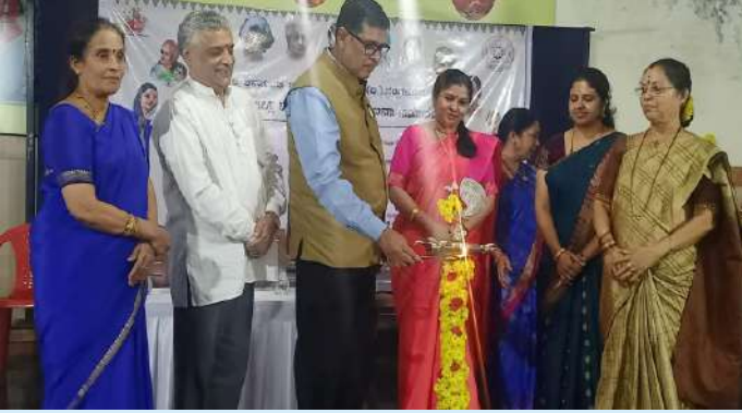
ಶಿವಮೊಗ್ಗ ಜಿಲ್ಲಾ ಮಹಿಳಾ ಘಟಕದ ಉದ್ಘಾಟನಾ ಸಮಾರಂಭ