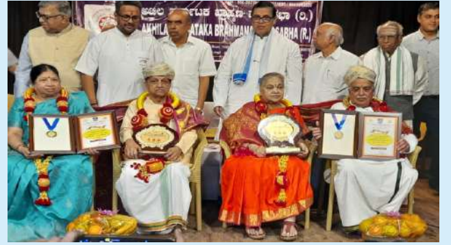
ಸಮಾವೇಶದಲ್ಲಿ ಹಿರಿಯ ಸದಸ್ಯರಿಗೆ ಸನ್ಮಾನ