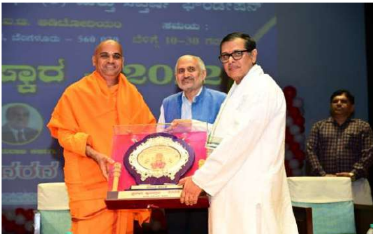
ಮುಖ್ಯ ಅತಿಥಿಗಳಿಗೆ ಗೌರವ ಸಮರ್ಪಣೆ ಅಧ್ಯಕ್ಷರಿಂದ