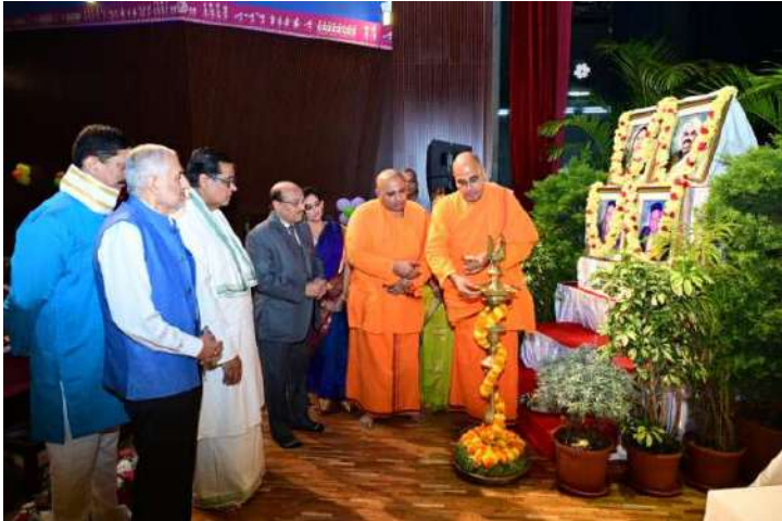
ಅತಿಥಿಗಳಿಂದ ಸಮಾರಂಭದ ಉದ್ಘಾಟನೆ