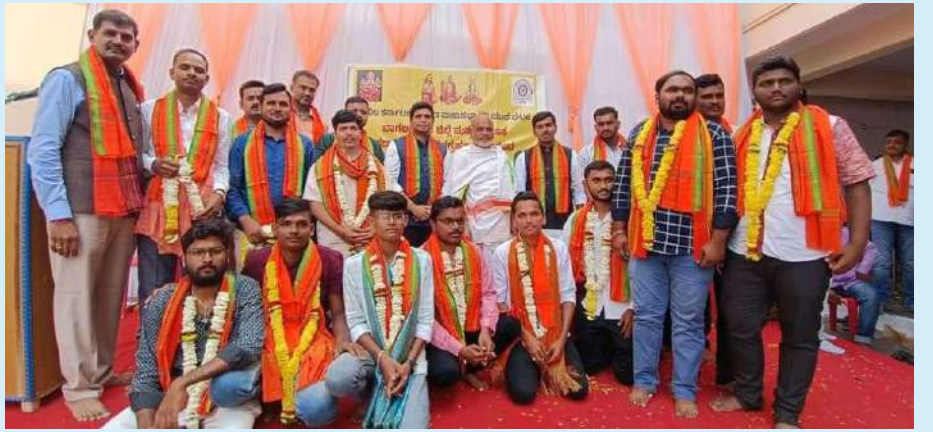
ಬಾಗಲಕೋಟೆ ಜಿಲ್ಲಾ ಯುವ ಘಟಕದ ಪದಗ್ರಹಣ ಸಮಾರಂಭ