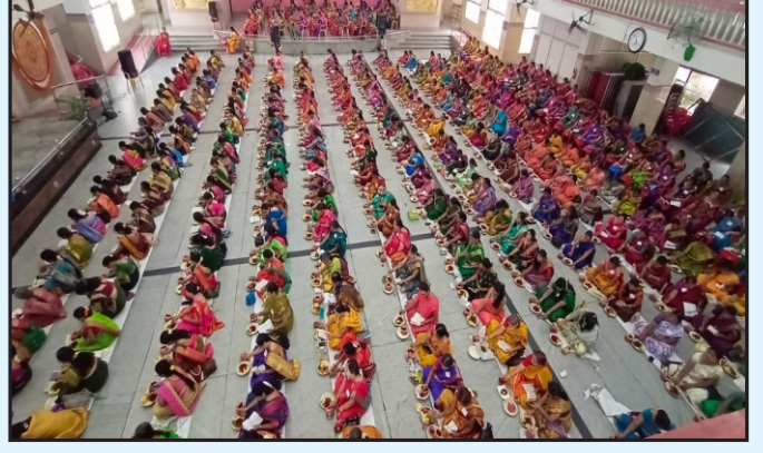
ಮಂತ್ರಾಲಯದಲ್ಲಿ ಲಕ್ಷ ಹರಿಕಥಾಮೃತಸಾರ ಪಾರಾಯಣ