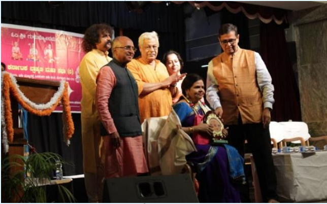
ಖ್ಯಾತ ನೃತ್ಯ ಕಲಾವಿದೆ ಶ್ರೀಮತಿ ವಿದ್ಯಾ ರವಿಶಂಕರ್