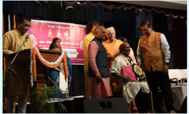
ಖ್ಯಾತ ಸುಗಮ ಸಂಗೀತ ಕಲಾವಿದ ಕಿಕ್ಕೇರಿ ಕೃಷ್ಣಮೂರ್ತಿ