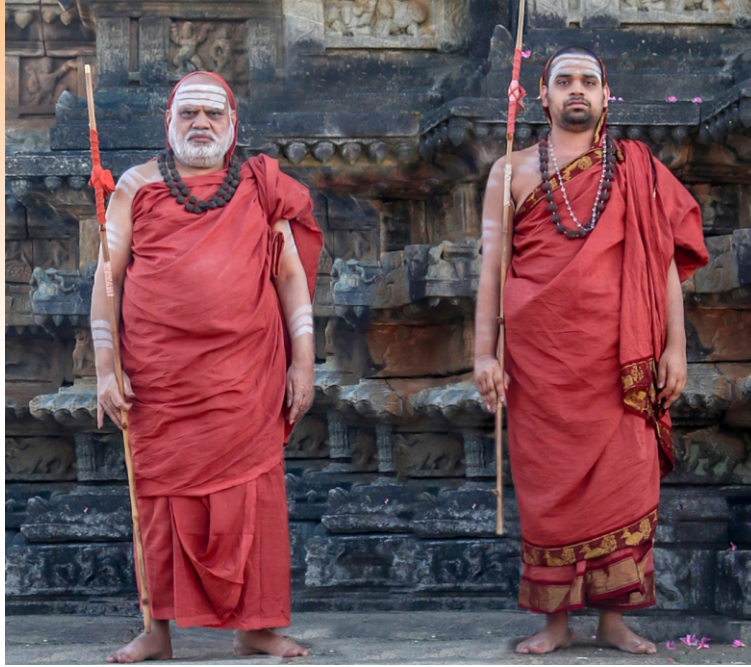
ಶ್ರೀ ಶೃಂಗೇಲಿ ಶಾರದಾ ಪೀಠದ ಜಗದ್ಗುರುಗಳಾದ ಶ್ರೀ ಭಾರತೀತೀರ್ಥ ಮಹಾ ಸ್ವಾಮಿಗಳು ಹಾಗೂ ಶ್ರೀ ವಿಧುಶೇಖರ ಭಾರತೀ ಮಹಾಸ್ವಾಮಿಗಳು