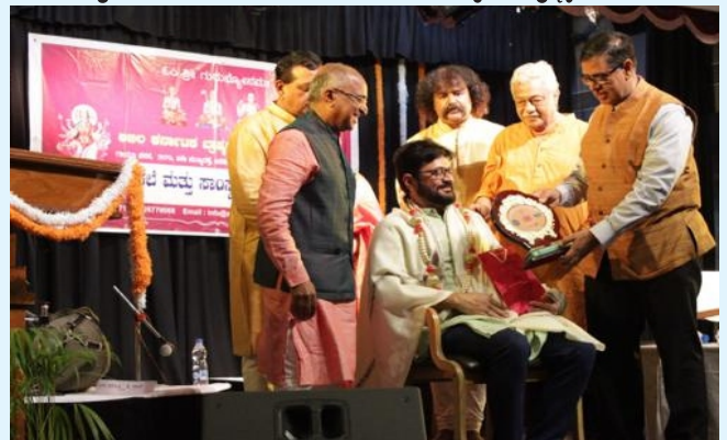
ಖ್ಯಾತ ಚಲನಚಿತ್ರ ನಟ-ನಿರ್ಮಾಪಕ ಸುನೀಲ್ ಪುರಾಣಿಕ್