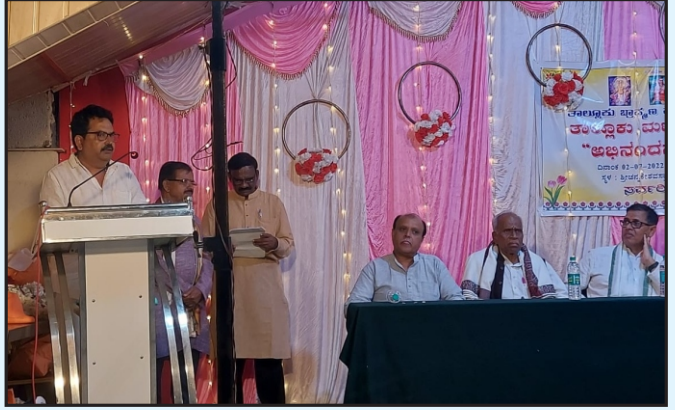
ಬೇಲೂರಿನಲ್ಲಿ ನಡೆದ ವಿಪ್ರ ಸಮಾವೇಶ ಸಮಾರಂಭ