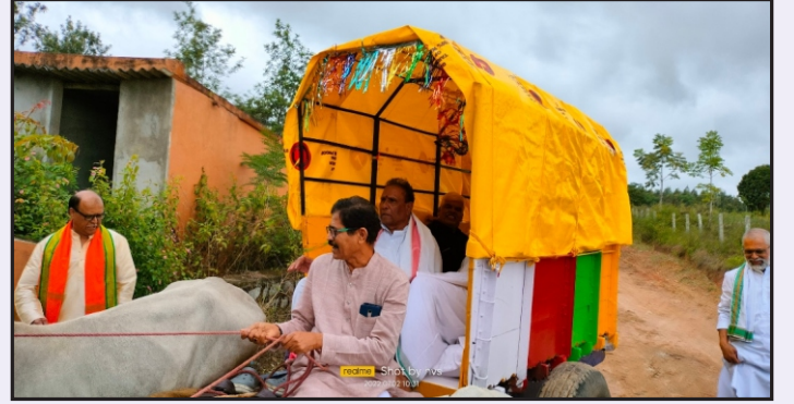
ಪದಾಧಿಕಾರಿಗಳಿಗೆ ಕಮಾನು ಬಂಡಿ ಸವಾರಿ ಸ್ವಾಗತ

ಮಹಾಸಭೆಯ ಮಾನ್ಯ ಅಧ್ಯಕ್ಷರು ಮಾತನಾಡುತ್ತಾ, ಸದಸ್ಯತ್ವ ನೋಂದಾವಣೆ ಬಗ್ಗೆ ಮತ್ತು ಸಂಘಟನೆ ಬಲವರ್ಧನೆಯ ಬಗ್ಗೆ ಸೂಕ್ತ ಸಲಹೆಗಳನ್ನು ವಿವರಿಸಿದರು. ಮತ್ತು ಸಭೆಯ ಆರ್ಥಿಕ ಪರಿಸ್ಥಿತಿಯನ್ನು ಉತ್ತಮಗೊಳಿಸಲು ಹಲವಾರು ಕಾರ್ಯಕ್ರಮಗಳನ್ನು ಕಾರ್ಯರೂಪಕ್ಕೆ ತರಲು ಅಮೂಲ್ಯವಾದ ಸಲಹೆಗಳನ್ನು ನೀಡಿದರು.