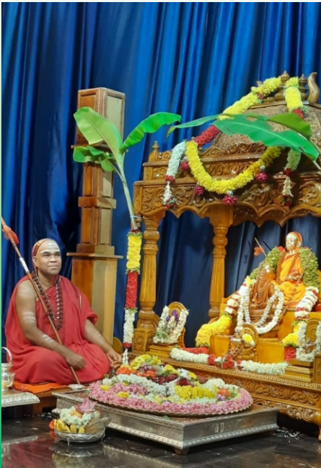
ಹಲಿಹರಪುರದ ಶ್ರೀ ಸ್ವಯಂಪ್ರಕಾಶ ನಜ್ಜಿದಾನಂದ ಸರಸ್ವತೀ ಮಹಾಸ್ವಾಮಿಗಳು