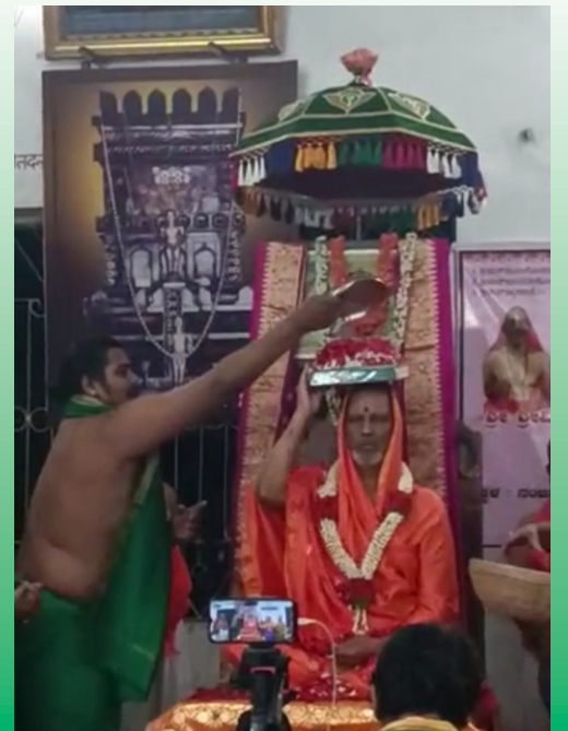
ವ್ಯಾಸರಾಯ ಪೀಠದ (ನೋಸಲೆ) ಶ್ರೀ ವಿದ್ಯಾವಿಜಯತೀರ್ಥ ಶ್ರೀಪಾದಂಗಳವರು